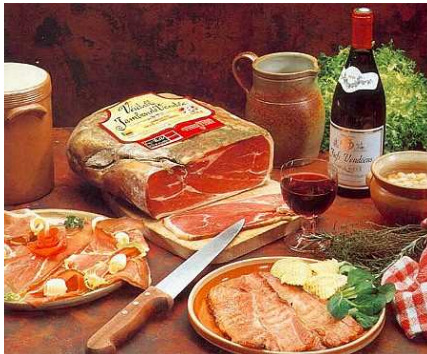
« Jambon de Vendée » entier, tranches épaisses et tranches fines

Grillé au feu de bois et accompagné de mogettes cuites au chaudron, le « Jambon de Vendée » est un met emblématique de la gastronomie traditionnelle vendéenne.