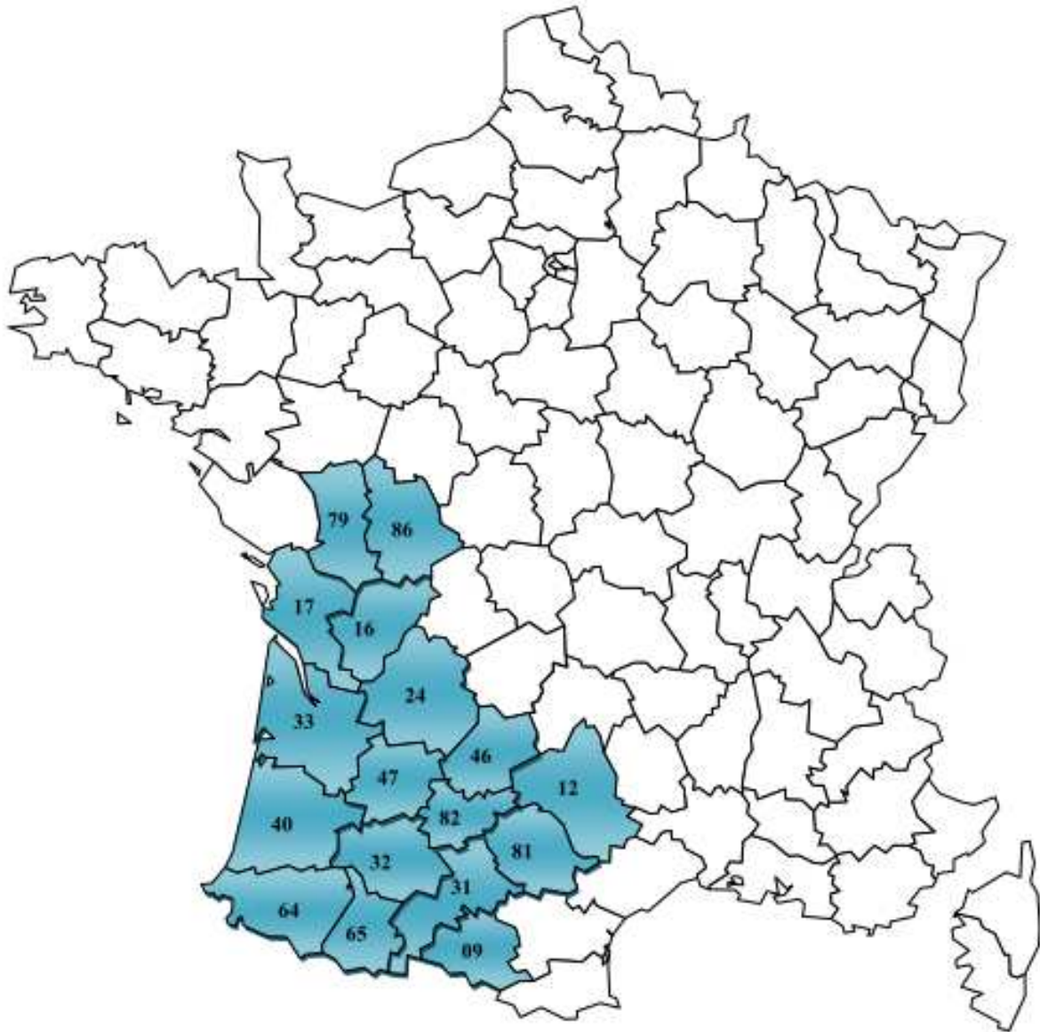
CARTE 1. AIRE GEOGRAPHIQUE DE L'IGP PORC DU SUD-OUEST