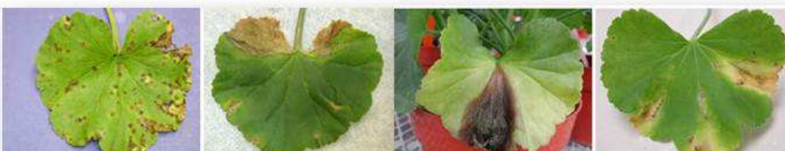
Bactérie ( Xanthomonas )