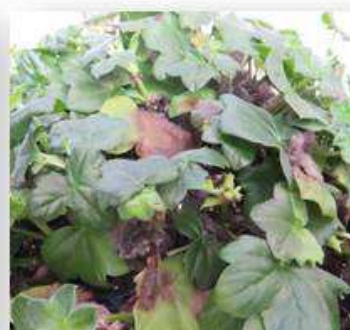
Champignons ( Botrytis )