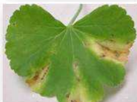
Bactérie ( Xanthomonas )