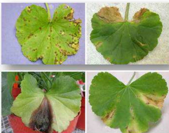
Bactérie ( Xanthomonas )