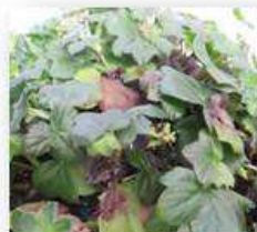
Champignons ( Botrytis )